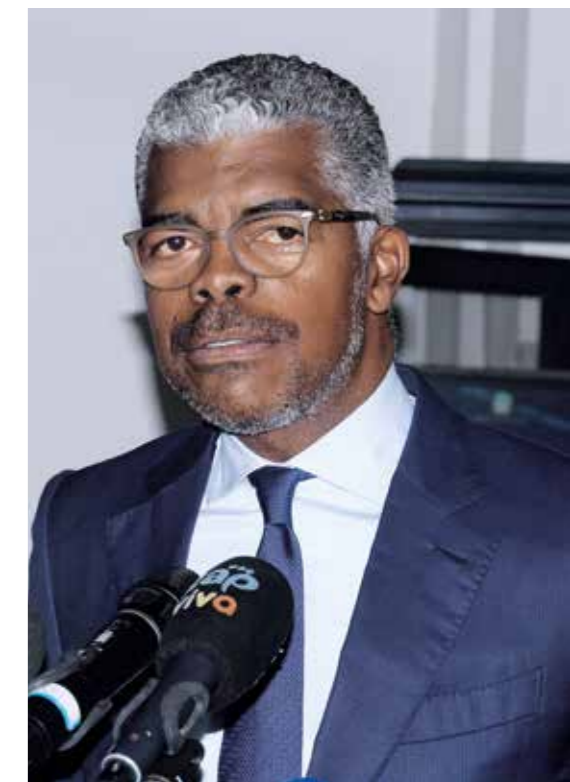
Ministro dos Transportes de Angola, Dr. Ricardo D’Abreu

e a nova lei sobre contratos públicos, o plano de ordenamento portuário, contratação pública (Nova lei dos Contratos Públicos”, alteração ao código penal e processo penal angolano e sua aplicação para as empresas públicas foram, entre outros temas em análise no primeiro encontro de quadros do porto do Lobito. O ministro dos Transportes, Ricardo D’Abreu assegurou ainda que a transformação do Porto do Lobito (provincia de Benguela) num “landlord port” (porto senhorio) vai melhorar significativamente o seu desempenho, como já sucede há décadas em Luanda. Para ele, o que faz uma boa empresa são as pessoas focadas nos seus objectivos e metas, para torná-la cada vez mais viável e rentável. “O seu desempenho vai proporcionar melhores condições remuneratórias, contínuo processo de capacitação e valorização do capital humano e consequentemente melhor qualidade de vida aos trabalhadores e respectivas famílias”, alertou o governante.