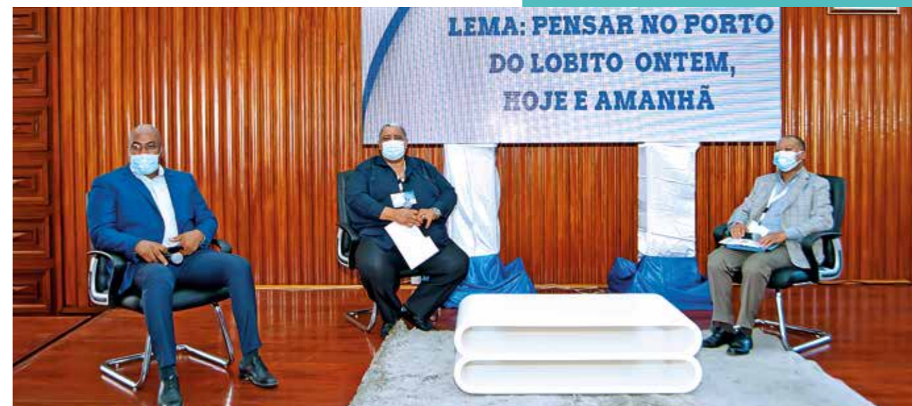
Administrador Municipal do Lobito - PCA do Porto do Lobito - PCA do CFB