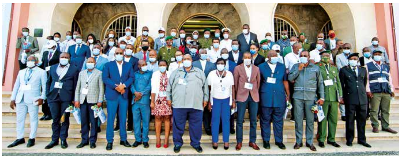
18 E 19/2021 – 1º ENCONTRO DE QUADROS DO PORTO DO LOBITO